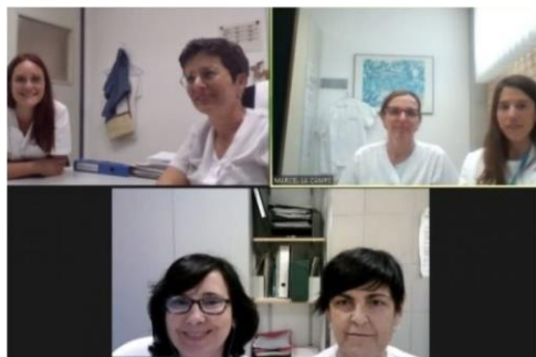
Responsables del proyecto en los tres centros del Consorcio Sanitario Alt Penedès-Garraf (CSAPG)